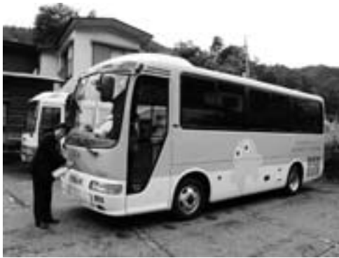
■交通安全を願い、タバスキーバス発進！ 7月17日(金)、新しいバスが納車されました。やっと都内にも出かけられますね。