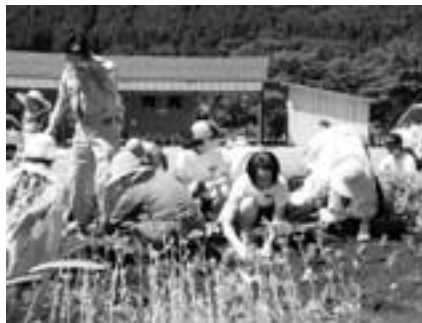
■きれいな花を咲かせましょう！ 7月14日(火)、老人クラブと中学生の交流会で花植えを行いました。