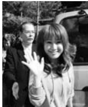
▼いつも笑顔の愛さんでした