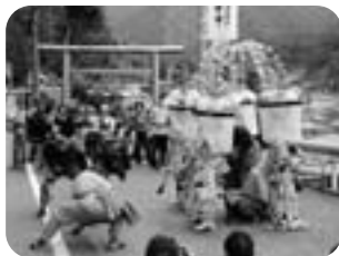
▲雌獅子隠し (奥秋・子の神社)