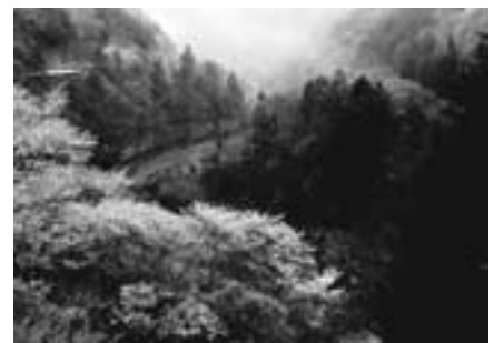
▲I部 優秀賞「雨に煙る山間」 高尾久男