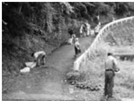
■村民みんなで村をきれいにしよう！ 7月4日(土)、夏の観光シーズンを控えての村内清掃活動を行いました。