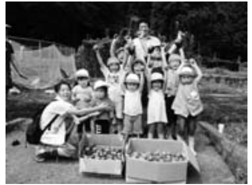
■見て見て、こんなにたくさん掘れたよ！ 7月30日(木)、保育所のいも掘り会を行いました。大きなおいもに大喜びです。