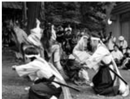
■丹波の夏、こども獅子の熱い舞い！ 7月11日(土)、小学生もこの力強さとしなやかさ。さすが丹波の子です。