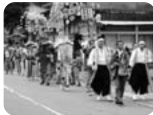
▲道中 (各地区・移動中)