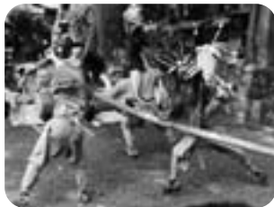
▲竿がかり (下組・熊野神社)