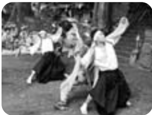
▲帯がかり (下組・熊野神社)