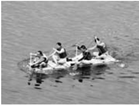
■多摩川の源流から漕いで来ました？ 7月19日(日)、粕江市の多摩川いかだレースに丹波山チーム6回目の出場です。