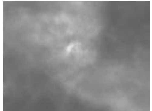
■一瞬ですが、日食が見られました！ 7月22日(水)、わずかな雲の切れ目から三日月形の太陽が顔をのぞかせました。