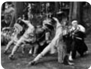
▲白刃の舞 (下組・熊野神社)