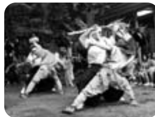
▲笹がかり (押垣外・川上神社)