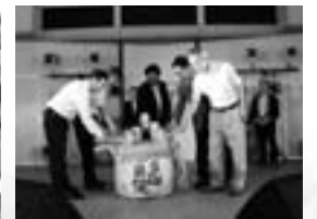
▲鏡開きでオープニング