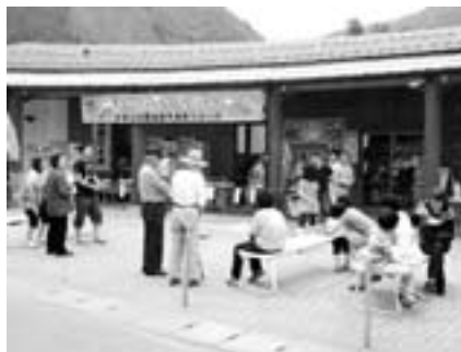
■おいしいイモ煮に大満足！ 7月5日(日)、じゃがいも祭り。鹿肉フライにも注目が集まりました。