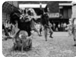
▲幣がかり (上組・飛竜権現)