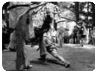
▲花がかり (高尾・大六天神社)