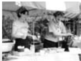
▲夫婦でケーキづくり