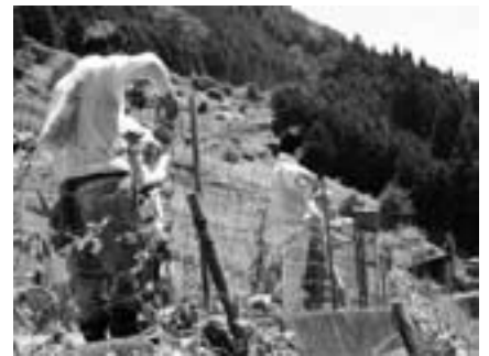
■農作物を鳥獣害から守ろう！ 7月16日(木)、農家が協力して鳥獣防護柵の点検、補修を行いました。