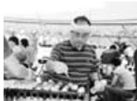
▲家族総出でたこ焼き