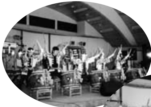
▲上野原市西原の三頭太鼓