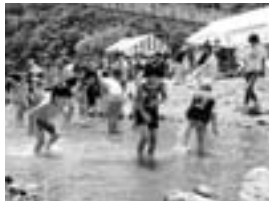
▲マスのつかみ取り