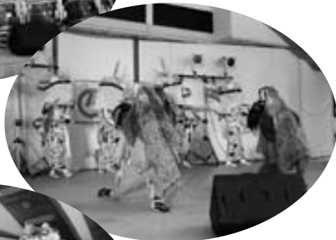
▲丹波山のささら獅子