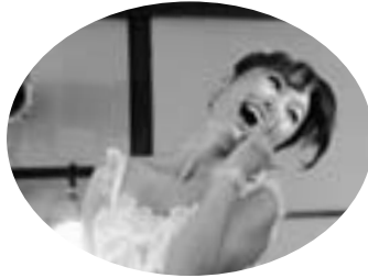
▲はるな愛さんのショー