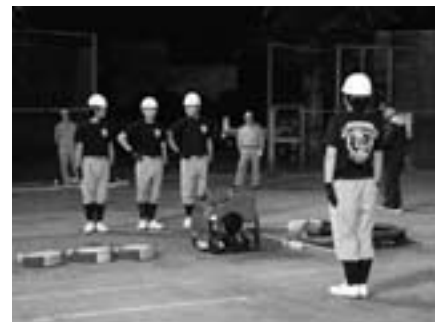
■消防団、やる気まんまんです！ 7月7日(火)、9月に行われる県大会に向けて訓練を強化、猛特訓中です。