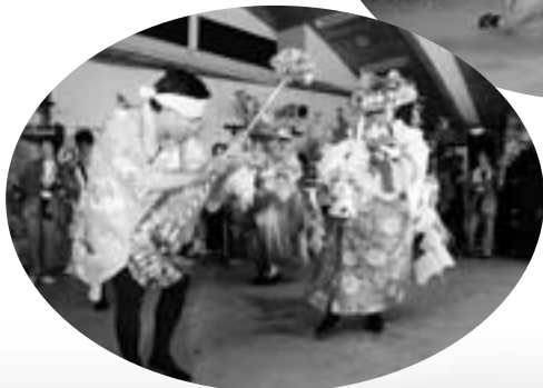
▲甲州市一之瀬高橋の春駒